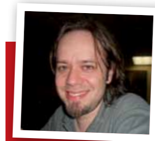
(*) Director de las carreras de Ciencia Política y Relaciones Internacionales de la Universidad de Belgrano. Autor del libro Los porteños en las urnas .

está nacionalizado, los resultados en las diferentes provincias se distribuyen más o menos uniformemente. Por ejemplo, la última elección de la ciudad, analizada por comuna, mostró uniformidad: tomando la primera vuelta, si bien el voto por Macri se disparó en Recoleta y otros barrios del norte, en el resto del mapa osciló entre el 40 y el 50%, siempre con Filmus en segundo lugar, con un promedio de 47%. Las elecciones presidenciales de 2003, en cambio, fueron las más desnacionalizadas que se recuerden: el peronismo se partió en tres, en la zona norte del país ganó Carlos Menem, en Buenos Aires y la zona sur lo hizo Kirchner y en Cuyo predominó Alberto Rodríguez Saá, mientras que Elisa Carrió y Ricardo López Murphy hicieron buenas elecciones en algunos distritos y casi no existieron en otros.