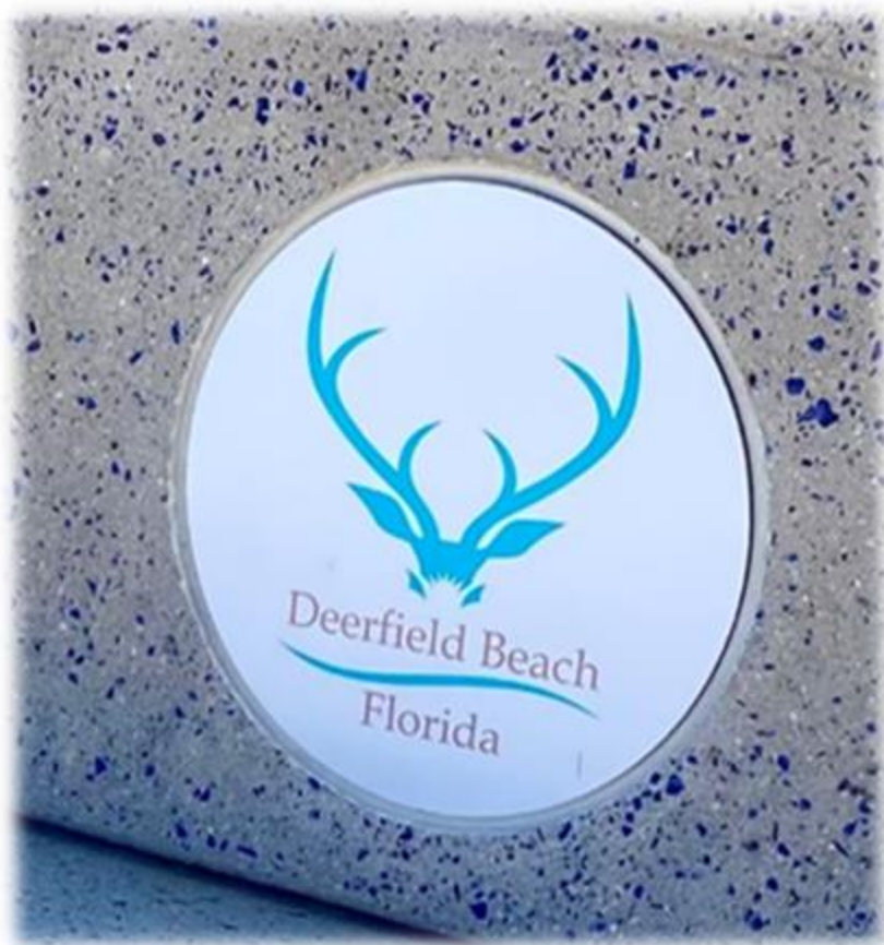
Figura: Logo de Deerfield Beach - material propio .

Se la denomina Deerfield Beach porque “ Deer “en el idioma inglés significa ciervo, antiguamente muchos ciervos solían deambular por esa zona.