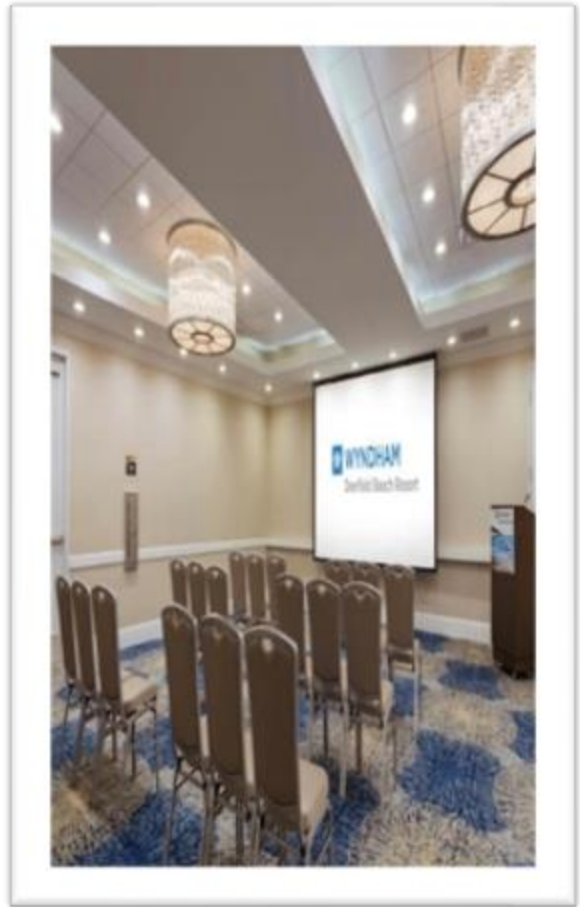
Figura: Restaurant del Hotel, Salón de Reuniones- Página -Oficial Wyndham.com [en línea ].