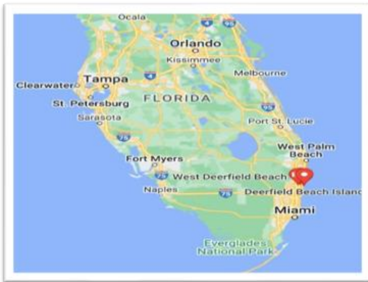
Figura: Google Maps.

La ciudad de Deerfield Beach está ubicada en el Estado de la Florida, Estados Unidos. Dicha ciudad está ubicada en el océano Atlántico entre la zona de West P West Palm Beach , la ciudad de Pompano Beach , y a cuarenta minutos de la ciudad de Miami .