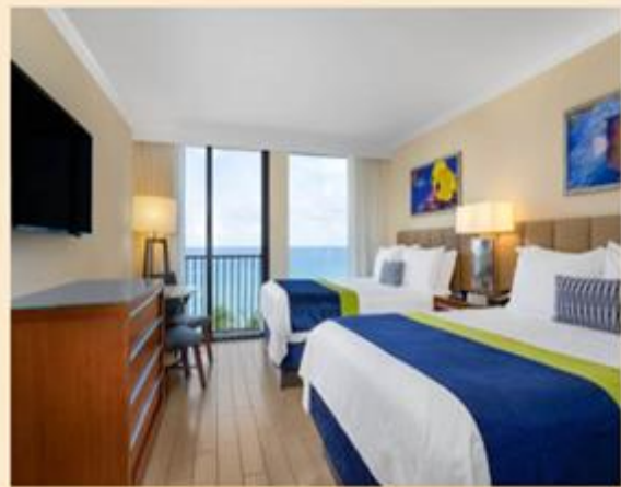
Double Queen Room

Relax in our King Rooms and experience the comfort of oceanfront lodging in Deerfield Beach. Book now to enjoy plush beds, balconies, and floor-to-ceiling views of the ocean and city.