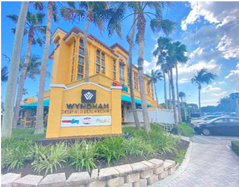
Figura : Fachada Exterior del hotel Wyndham Resort