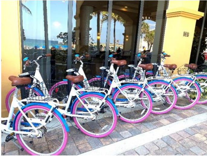
Figura: Bicicletas para los huéspedes del hotel Wyndham.