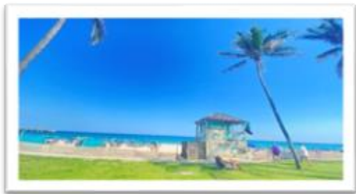
Foto: Paisaje de la playa de Deerfield Beach -material propio.