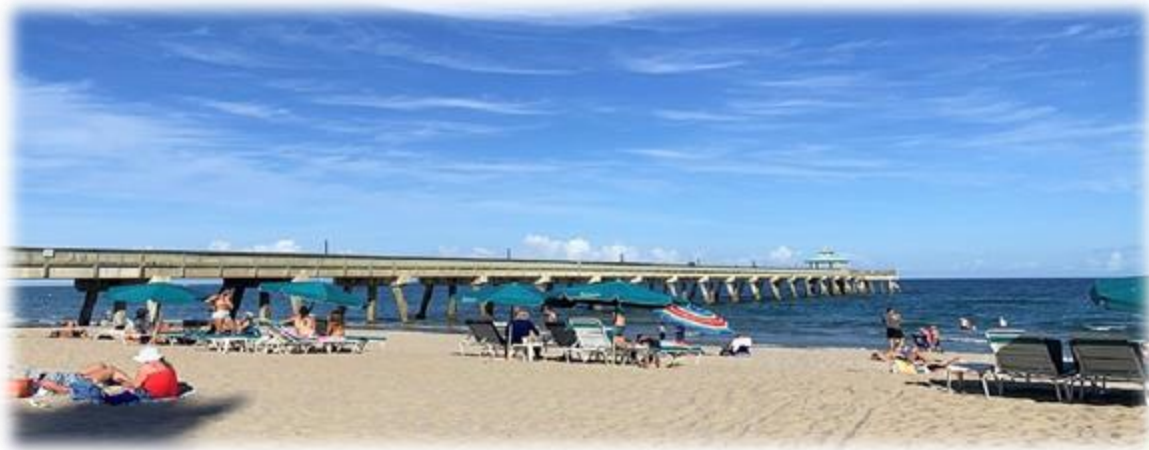
Figura: Muelle Deerfield Beach- planetware [en línea ] Activo mayo de 2023.