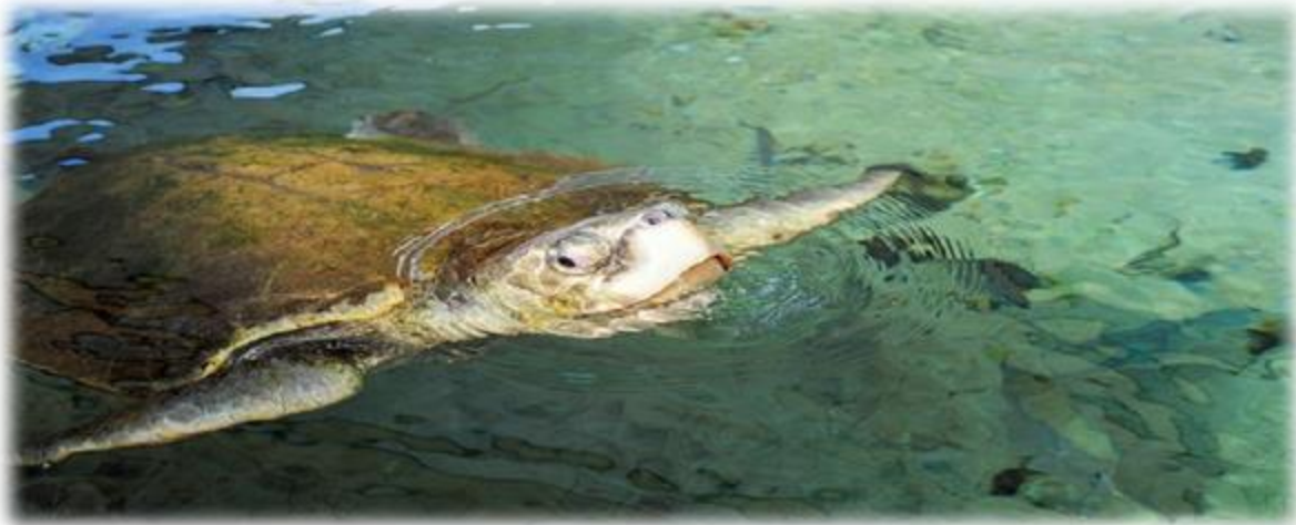
Figura : Planetware- Centro Natural Gumbo Limbo [en línea ]. Activo mayo de 2023.