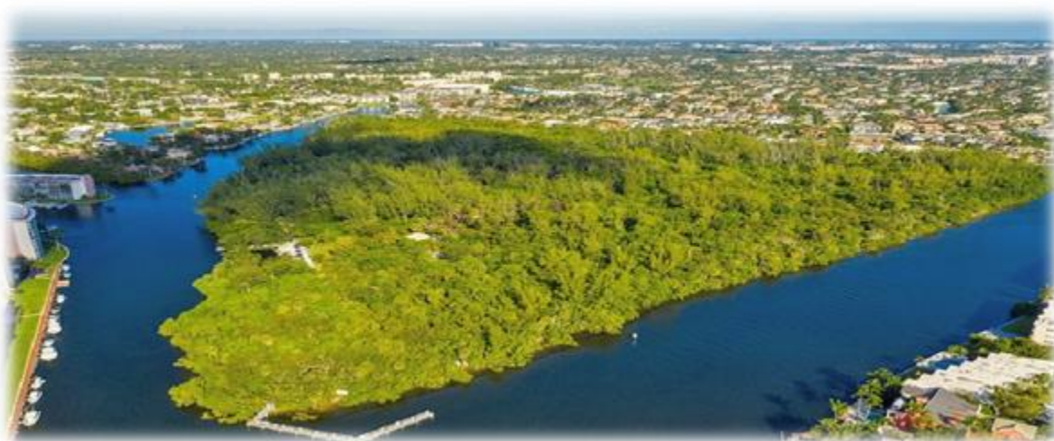
Figura: planetware- Deerfield Island Park [en línea ] Activo mayo de 2023.