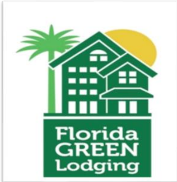
Figura: Página Oficial- Logo del Alojamiento Ecológico de la Florida- Florida Green Lodging Program-Floridadep.gov. [en línea ].

Una vez asignada la certificación de Alojamiento ecológico de la Florida, Florida Green Lodging Program su duración es de tres años a partir de la fecha de emisión.