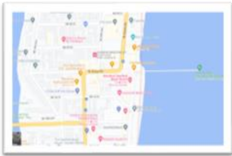
Foto: Ubicación del Wyndham Resort

El Hotel Wyndham Resort Deerfield Beach , se encuentra sobre la costa de la Ciudad de Deerfield Beach en el sur del Estado de la Florida, Estados Unidos.