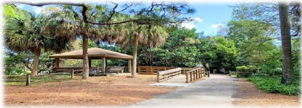
Figura: planetware- Arboretum [en línea ] Activo mayo de 2023.