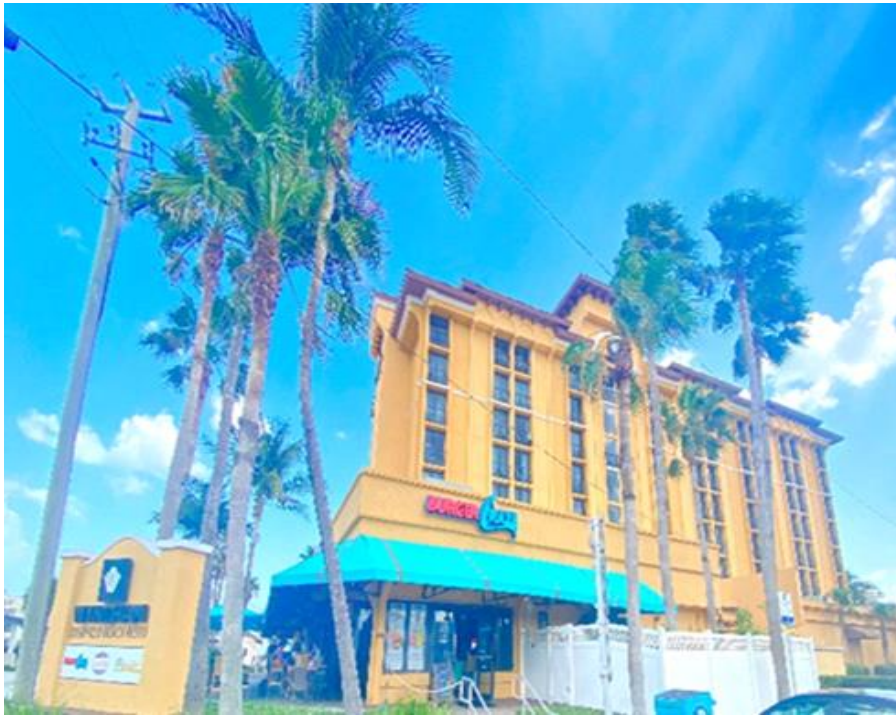
Figura : Fachada Exterior del hotel Wyndham Resort Deerfield Beach