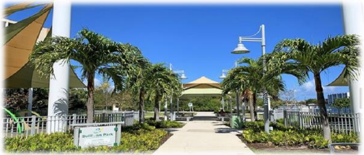
Figura: planetware- Parque Sullivan [en línea ] Activo mayo de 2023.