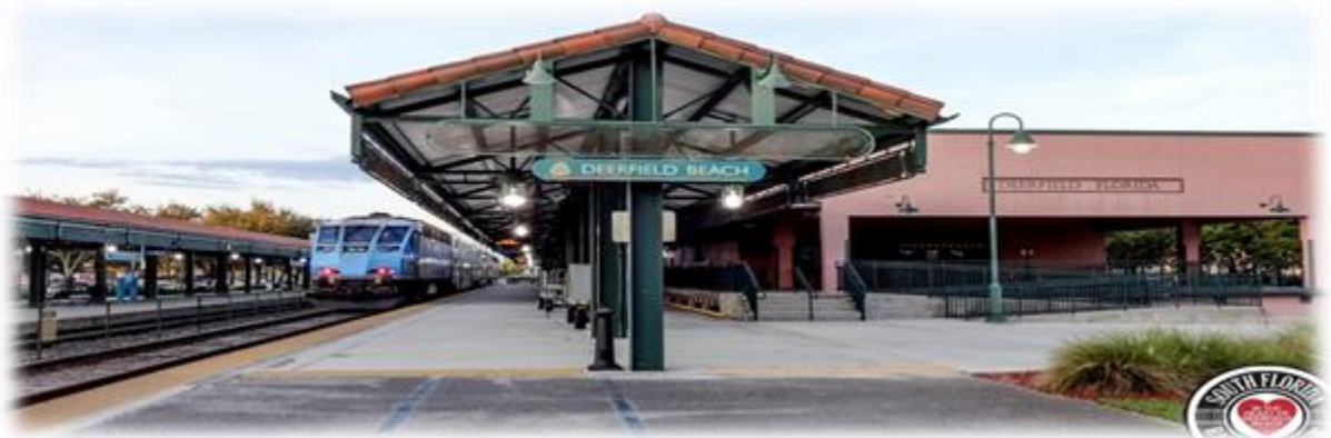
Foto: visit lauderdale -Museo del Ferrocarril [en línea ] Activo mayo de 2023.