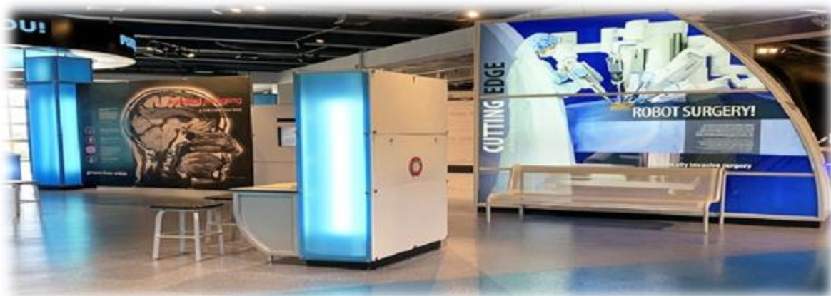
Figura: planetware- Museo del descubrimiento y ciencia [en línea ] Activo mayo de 2023.