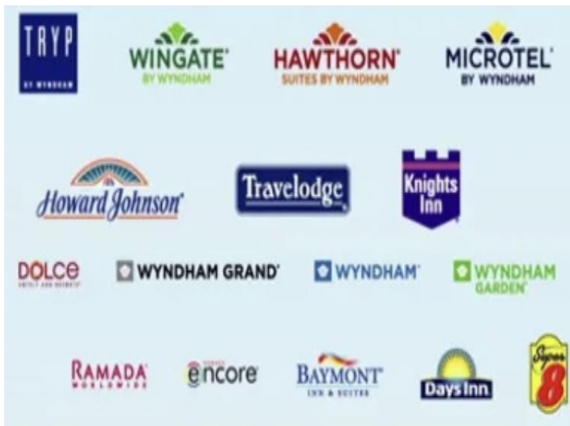
Figura: Marcas de los Hoteles- Wyndham Group - succesfulmeetings.com [en línea ]

Dentro de estas categorías se pueden encontrar el Wyndham Hotel Group , que consta de 7200 hoteles en franquicia, que incluyen a los hoteles Days Inn , Wyndham Hotel Resorts , Howard Johnson , Super 8 , Ramada y Planet Hollywood .