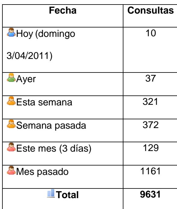
Tabla 1. Consultas realizadas en el portal web del programa, entre diciembre 2010 y abril 2011. en http://www.investigacionsalud.com/ , se exponen los aspectos programáticos, informes de avance, datos estadísticos,

mapas de georeferenciación, materiales de capacitación y educación comunitaria, links de bibliotecas virtuales, materiales de apoyo para la investigación, módulos para educación virtual. Todos estos recursos son utilizados no solamente por estudiantes, docentes, personal de salud y comunidades involucradas en el programa de investigación, sino también por usuarios del internet a nivel mundial.