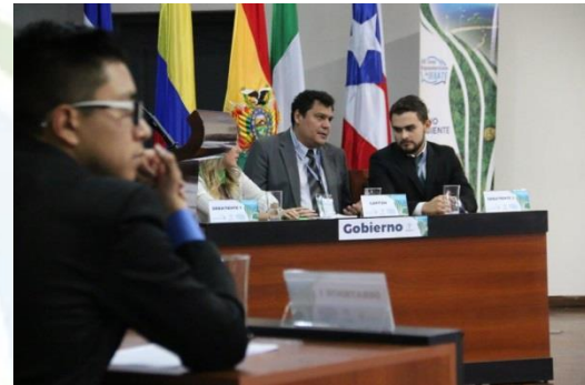
Debate RLCU, 2017.

Los invitamos a reservar la semana mencionada en su agenda institucional y esperamos contar con la participación de su(s) equipo(s) de debate en Cali, Colombia.