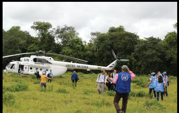
UK Mission to the UN/Lorey Campese

Todo esto lleva a la conclusión que la problemática no debería ser abordada desde la óptica y la lógica exclusiva del Estado-Nación, ya que la misma sobrepasa las medidas que éste propone, mostrándolo incapaz de enfrentarla por sí solo. No hay duda que el fenómeno migratorio, tanto por razones de desplazamiento forzado interno como externo, resulta una cuestión que afecta el orden global, y es por ello que es momento que la comunidad internacional tome