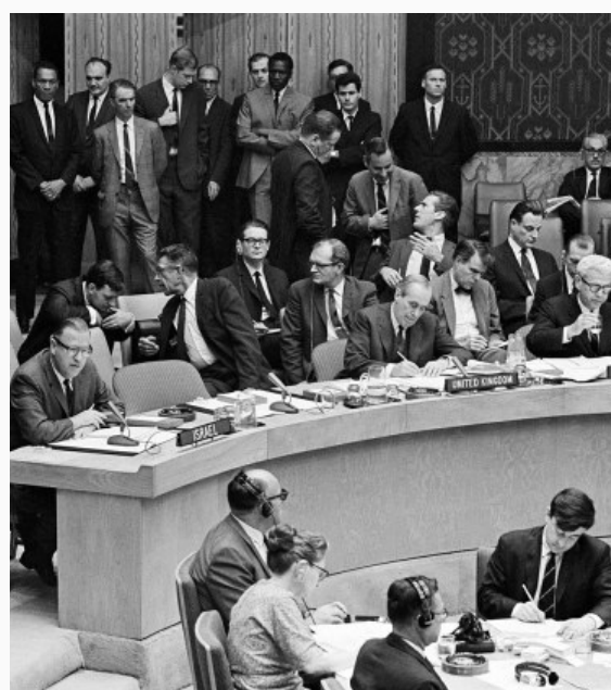
Resolución 242