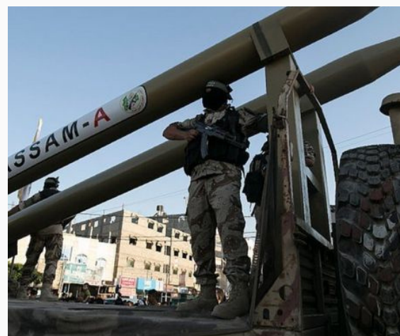
Misiles Qassam de Hamás