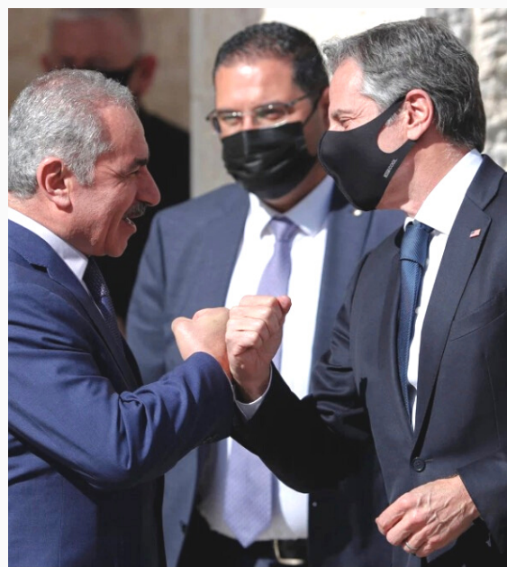
Antony Blinken y el primer ministro palestino, Shtayyeh en su reciente encuentro.