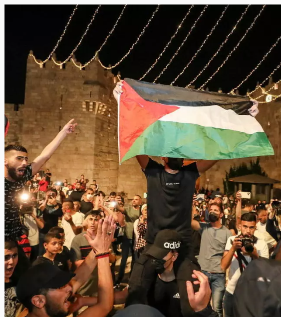
Festejo por el desbloqueo de la Puerta de Damasco

En respuesta, la ultraderecha judía realizó una marcha con el lema “ muerte a los árabes ” que desencadenó nuevamente enfrentamientos en los que la policía tuvo que intervenir. Por un lado, las fuerzas de seguridad comunicaron que los manifestantes arrojaron piedras desde la mezquita al-Aqsa en el Monte del Templo. Por el otro, los palestinos informaron que sufrieron disparos de granadas paralizantes, que derivaron en decenas de heridos. Con esto en mente, Jerusalén y el Estado de Israel no tardaron en convertirse en territorio de profanaciones religiosas de ambos lados, tanto en templos como en mezquitas.