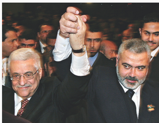
La AP y el dirigente de Hamás