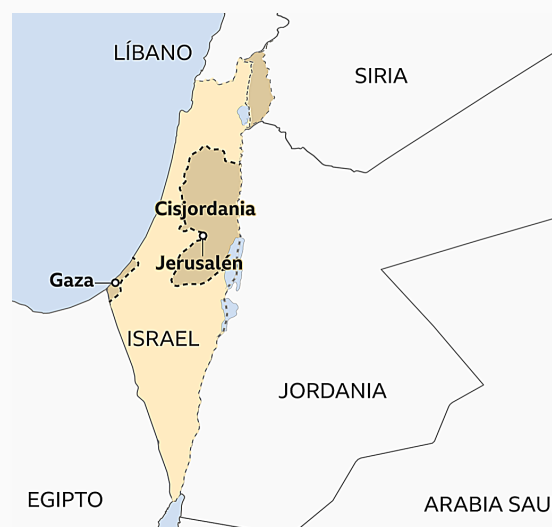
Mapa de la región