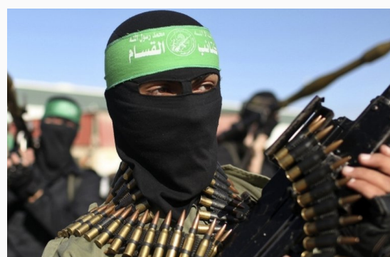
Brazo armado de Hamás, Qassam Brigades