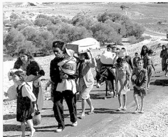
Refugiados palestinos

Años más tarde, en lo que fue conocido como la Guerra de los Seis Días (1967), Israel aumentó su territorio ocupando Jerusalén completamente, la Franja de Gaza y Cisjordania, entre otros territorios. Ante esto, la ONU promulgó la Resolución 242 , que planteaba una retirada israelí de los territorios ocupados en esa guerra. Exactamente ese es el quid de la cuestión: una de las aristas históricas del conflicto es la no retirada total israelí de estos lugares.