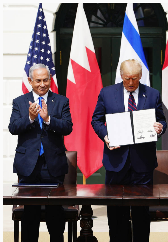
Firma de los denominados Acuerdos de Abraham