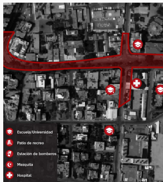
Túnel de Hamás en Israel localizado por las FDI

La idea de una tregua en la zona surgió gracias a la presión de la comunidad internacional. Las alternativas pacíficas eran la mediación del conflicto a través de una tercera parte (Egipto o la ONU) o un alto al fuego unilateral por algunos de los actores, esperando la misma respuesta de la parte contraria. Sin embargo, días previos al cese de hostilidades, políticos israelíes sostenían que el conflicto sólo terminaría cuando al menos una de las partes hubiera logrado sus objetivos. En esta línea, Netanyahu consideró la Operación Guardián de los Muros como un éxito basándose en que se logró el objetivo central , que era infligir un duro golpe a las organizaciones terroristas y restaurar la tranquilidad sobre la base de la disuasión . En este