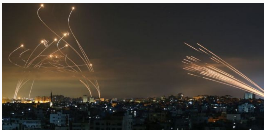
Los misiles israelíes por interceptar los cohetes de Hamás

Con el fin de comprender la reciente escalada social y militar en el conflicto entre Israel y Palestina, con sus consecuencias bélicas, es necesario no pensarlo como un único detonante sino analizar las diferentes aristas que llevaron a este nuevo escenario. Deben tenerse en cuenta tanto el contexto y su historia, como los incidentes recientes.