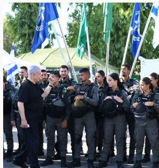
Netanyahu y miembros de la policía fronteriza