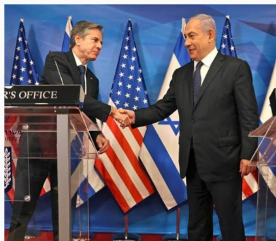
Blinken y el primer ministro israelí, Benjamin Netanyahu