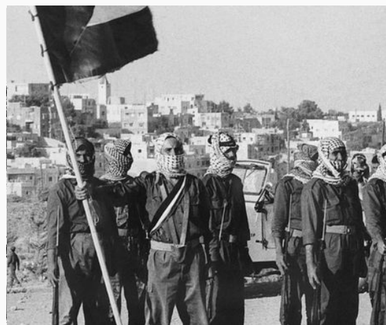
El movimiento nacional palestino se autonomiza de los gobs. árabes.