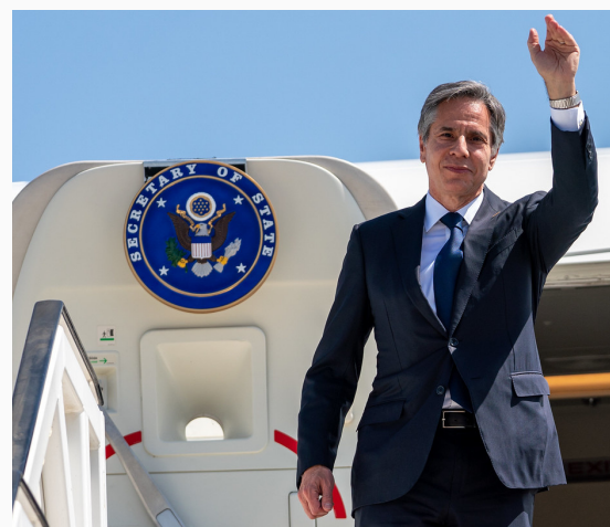
Blinken en su gira por la región

Por último, las claves del conflicto no se pueden analizar como hechos aislados, ni la cuestión bélica, ni la historia, ni la pugna social. Es importante entender todas estas aristas para llegar a una opinión formada. Hasta el día de hoy, hay mucho temor e incertidumbre por las dos partes involucradas.