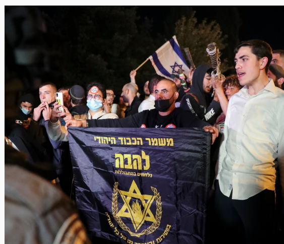
Grupo judío de extrema derecha Lehava