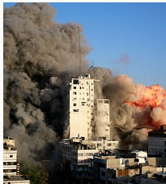
Torre destruida por los ataques aéreos israelíes en Gaza.