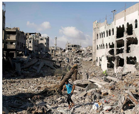
La urgencia de reconstruir Gaza