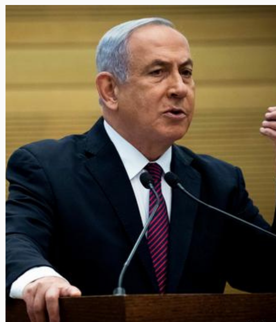
Primer ministro israelí, Benjamin Netanyahu