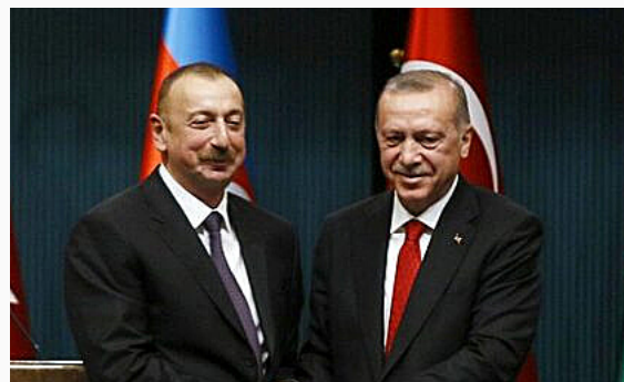
El presidente turco, Recep Tayyip Erdogan y el presidente azerbaiyano, Ilham Aliyev

La postura negacionista del Estado de Turquía afecta tanto en una dimensión local como global. Ha dejado, y sigue dejando, presos y exiliados políticos en su país. Internacionalmente, el no reconocimiento plantea la estructura dinámica de muchas relaciones entre las cuales se encuentran algunos de los países más poderosos del mundo (como Rusia, Reino Unido y China, entre otros). En esta región, esta estructura está activa especialmente en las tensiones con Israel y los conflictos con Azerbaiyán-Armenia. Es por eso que, si bien el Genocidio Armenio como hecho histórico es innegable, su denominación es relativa pues al menos 2/3 de los países del sistema internacional no lo reconocen tampoco bajo la categoría de genocidio; su alteridad terminológica forma parte de la base del sistema político internacional tanto del Medio Oriente, como del mundo.