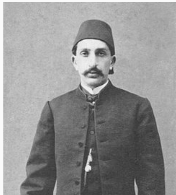
Sultán Abdul Hamid II