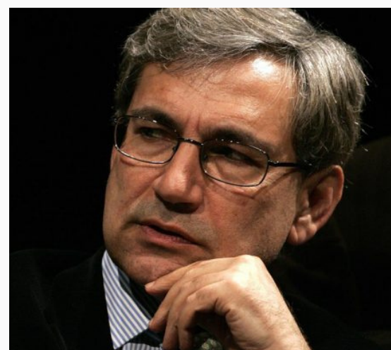
Orhan Pamuk