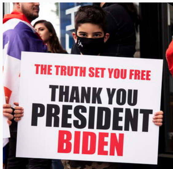
Agradecimiento a Biden por el reconocimiento del genocidio