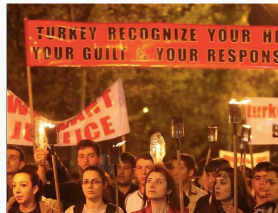
Marcha por el aniversario del genocidio armenio

Teniendo en cuenta esto, es necesario recordar que los presos, asesinados, y exiliados políticos de Turquía no son únicamente ellos dos. De hecho, son cada vez más los turcos que expresan su opinión sobre el Genocidio Armenio y son castigados por ello. Esta afirmación, la explica de una forma más clara Pamuk cuando expresa (en la misma entrevista): “Vivo en esa parte del mundo donde muchos escritores están encarcelados por sus creencias. Así que soy un escritor feliz y decir la verdad es todo lo que puedo hacer”.