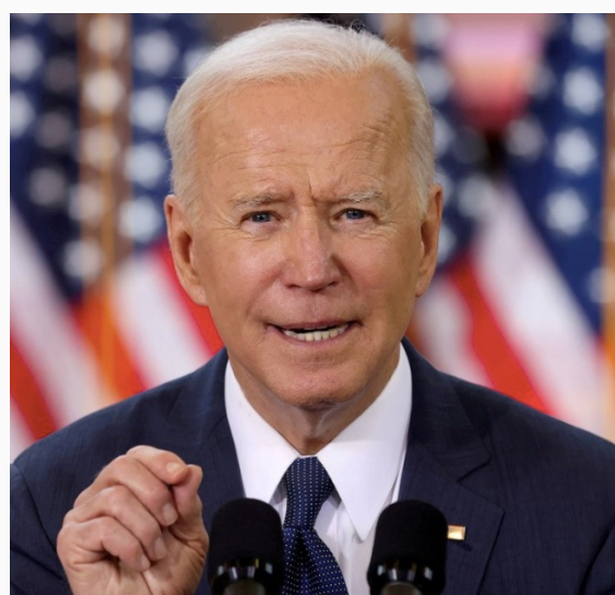
Presidente Biden durante la declaración

Al adentrarnos, entonces en el impacto del Genocidio Armenio en las relaciones entre estos dos países de Medio Oriente, se