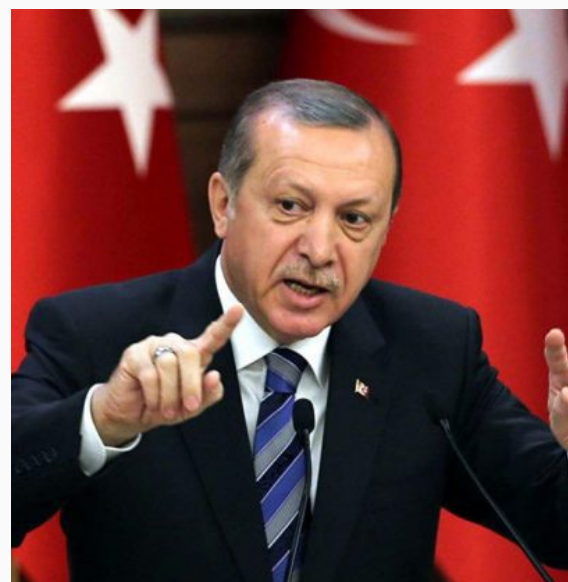
Recep Tayyip Erdogan