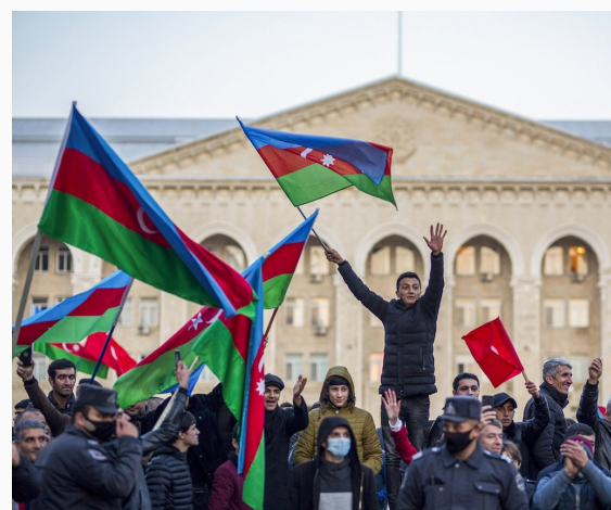
Festivos tras acuerdo de paz entre las partes