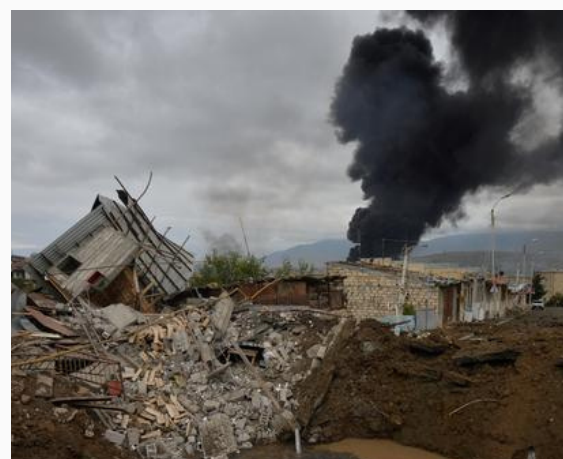
Escalada de tensiones