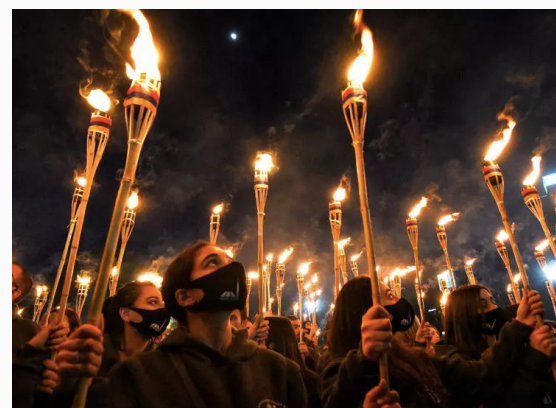
Procesión con antorchas en Ereván