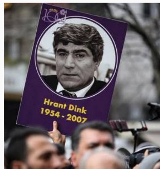
Protesta por el asesinato del periodista de origen armenio, Hrant Dink