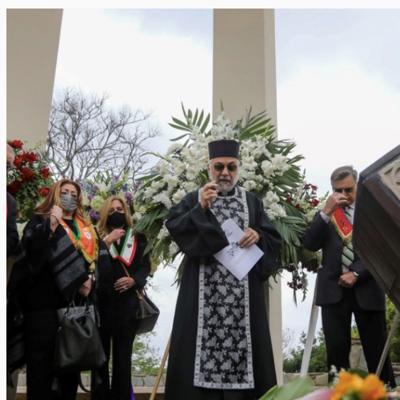
Comunidad armenia de California durante el último aniversario