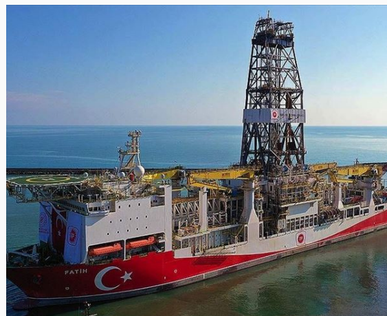
Barco de perforación Fatih

En los 90s, con el gobierno de George H. W. Bush, Estados Unidos busca afianzar el vínculo con Turquía ya que lo consideraba uno de los países más importantes de Medio Oriente, y cuyas visiones del mundo estaban unificadas. Por lo tanto, su relación se basa en una estrecha cooperación en un territorio amplio, extendiéndose desde el Cáucaso de Oriente Medio hasta los Balcanes y Asia Central. En esta alianza, se prometen la promoción de la paz y el apoyo permanente al conflicto árabe- israelí sobre la base de una democracia y de los dos Estados. También, incluía el fomento a la estabilidad en el Cáucaso, Asia Central y Afganistán, el Mar Negro y un Iraq unificado, además de la ayuda a los esfuerzos de frenar cualquier desarrollo de armas nucleares por parte de Irán que se apartara de sus compromisos internacionales, el fortalecimiento de las relaciones trasatlánticas, la lucha contra el terrorismo, y el aumento de la comprensión, el respeto y la tolerancia entre las religiones y culturas, y una acción para