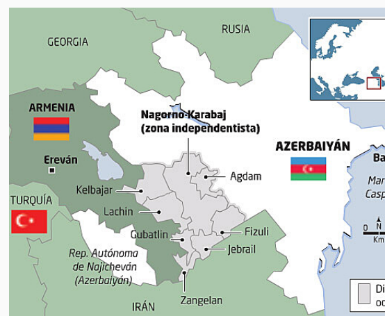
Territorio en disputa

Es entonces, cuando comienza la guerra de Nagorno-Karabaj, que se disputó entre dos bandos: el primero compuesto por Azerbaiyán y Turquía (quien no participó masivamente), como si lo hizo la Unión Soviética, enviando miles de soldados durante varios años y el segundo integrado por Artsaj y Armenia. En 1994 se llama a un alto al fuego, tras una gran cantidad de muertes. En 2016 hubo otro conflicto armado, llamado Guerra de Cuatro Días, disputada entre Azerbaiyán y Armenia. Cuatro años más tarde hubo nuevos enfrentamientos, esta vez Armenia apoyada por Rusia y Azerbaiyán junto a Turquía, que le proveía drones, armamento y soldados enviados