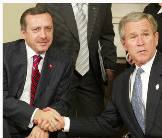
Encuentro entre el entonces presidente George Bush y el primer ministro Recep Tayyip Erdogan