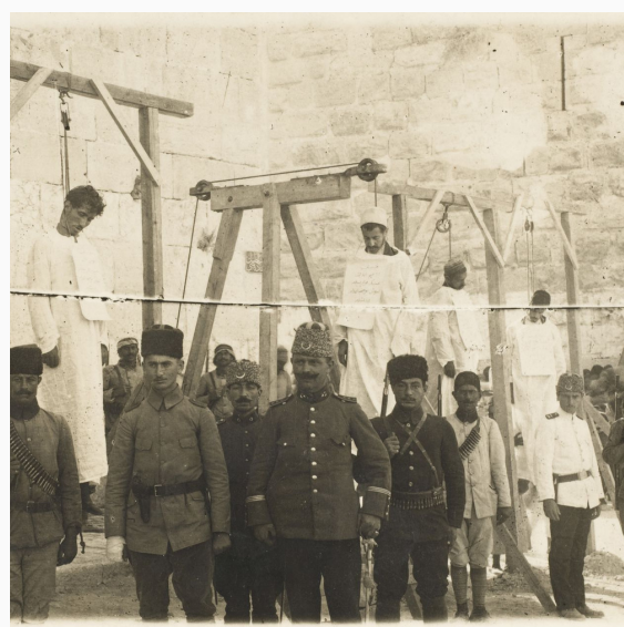
Jóvenes turcos tras asesinar a armenios