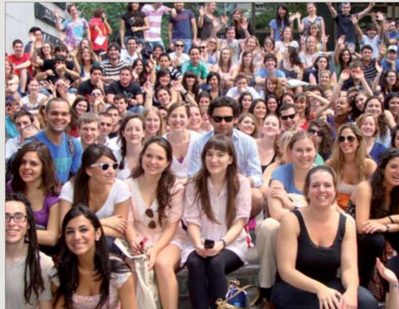
Estudiantes internacionales en la Torre Universitaria