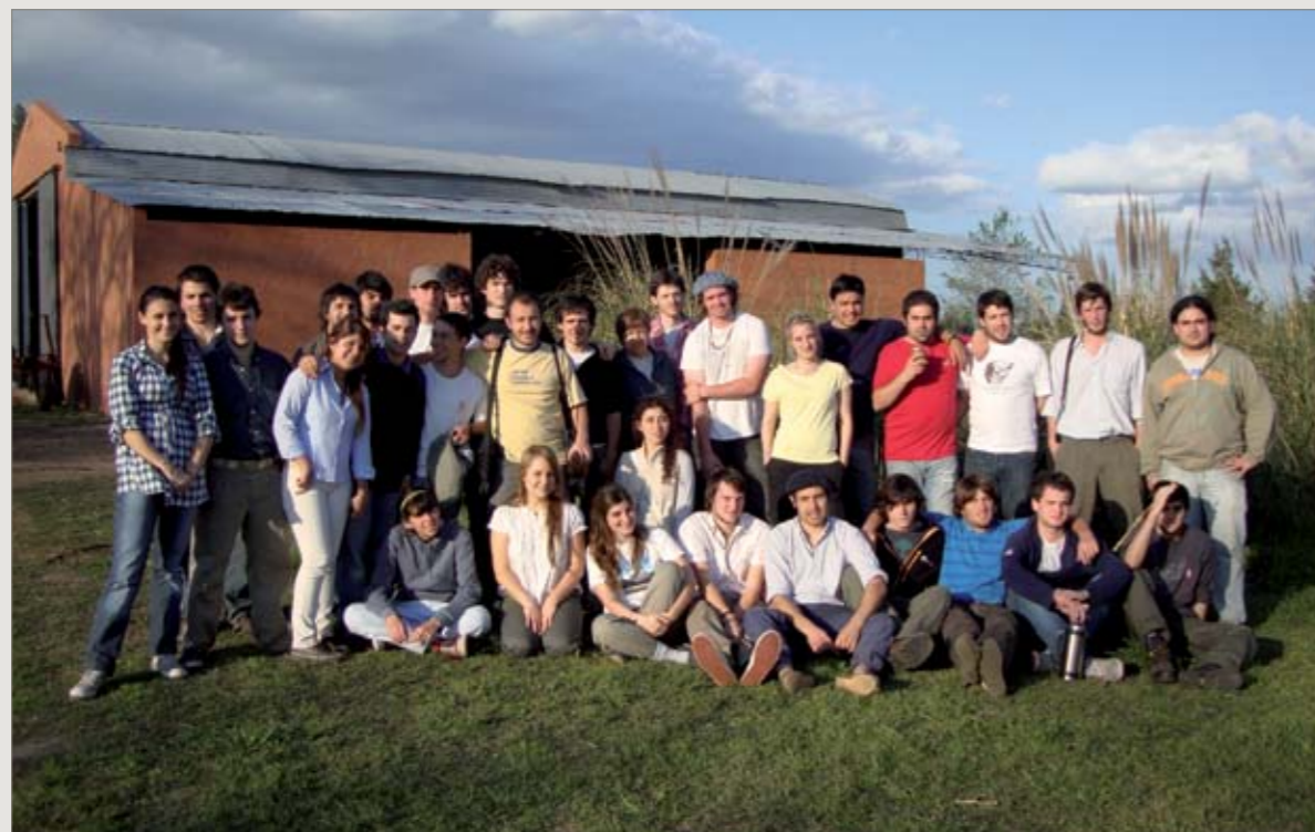
General Belgrano. Provincia de Buenos Aires