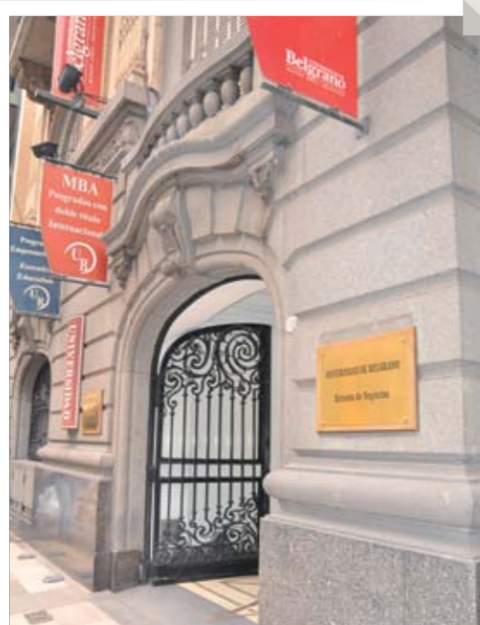
Sede Marcelo T. de Alvear 1560 Escuela de Posgrado en Negocios y Escuela de Posgrado en Derecho.