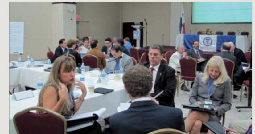
Grupos de trabajo del Taller de Planeamiento Estratégico. Panamá, octubre de 2011