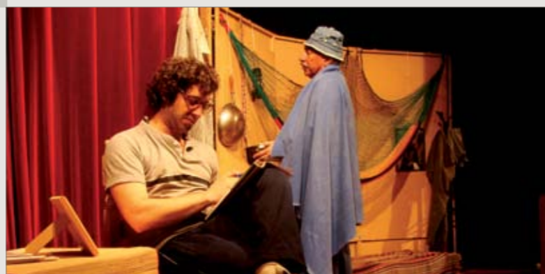
Taller de teatro UB