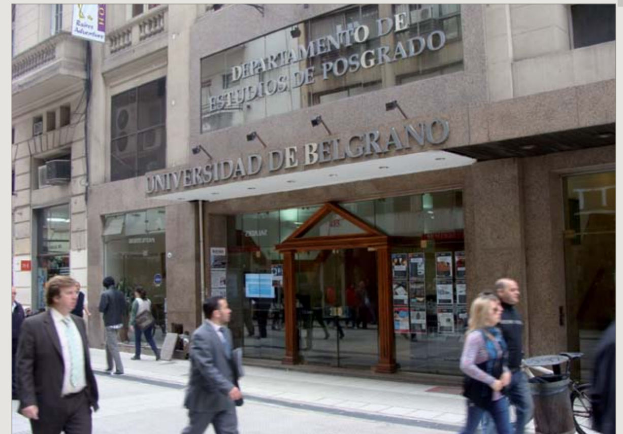
Sede Lavalle 485: Departamento de Estudios de Posgrado y Educación Continua