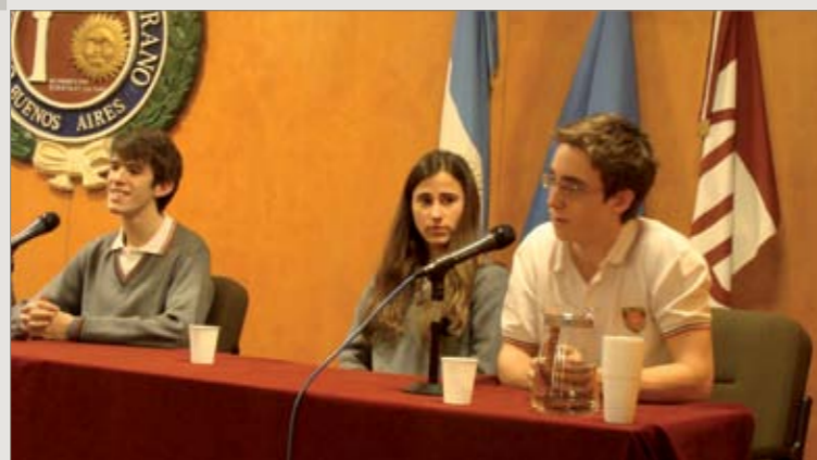
Segundo Encuentro de Jóvenes Ecologistas

Participantes: autoridades, decanos, directores de carrera, profesores, secretarios académicos, coordinadores de carreras de dos años, colaboradores de los departamentos de Educación e Ingresos y Servicio de Orientación al Estudiante.