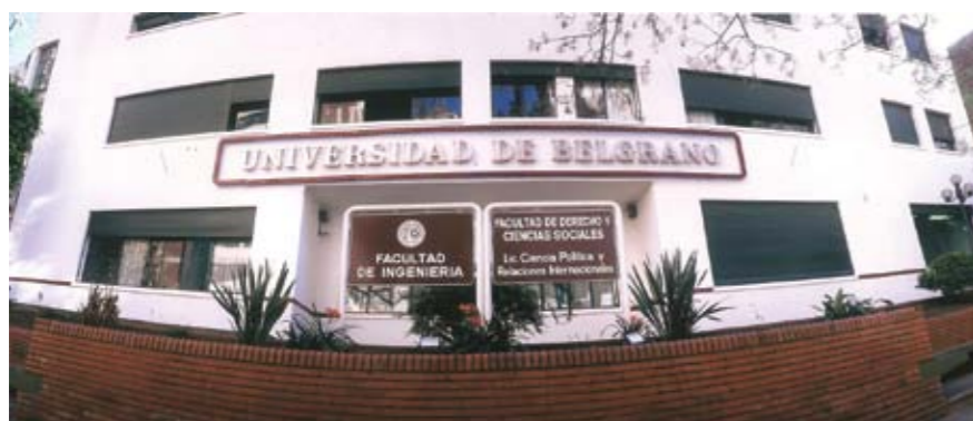
Sede Villanueva 1324 Facultades de Ingeniería; Ciencias Exactas y Naturales y Ciencias de la Salud.