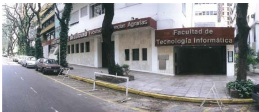
Sede Av. Federico Lacroze 1947 Facultades de Tecnología Informática y Humanidades (carrera de Producción y Dirección de TV, Cine y Radio).