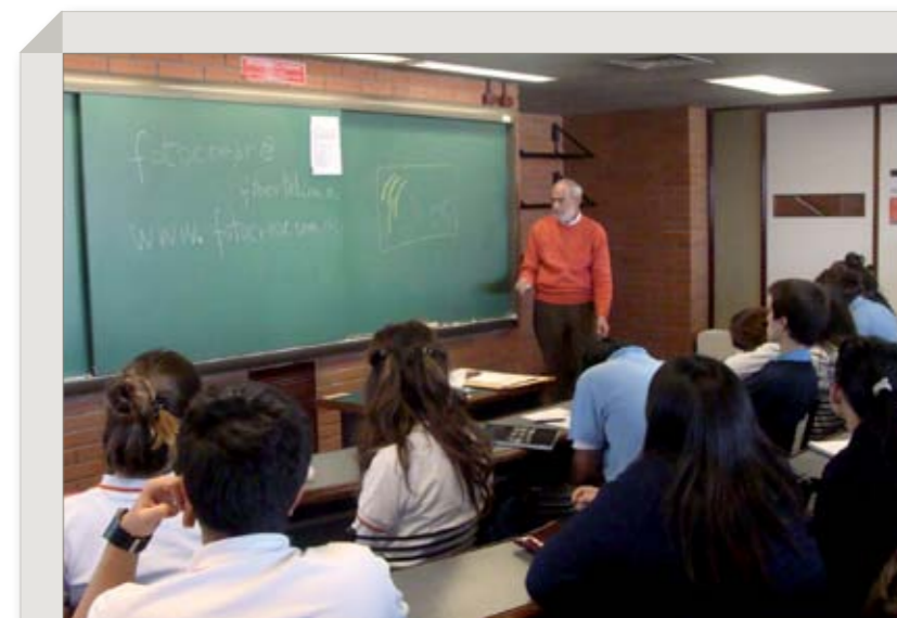
Taller de fotografía