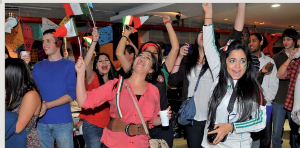
Estudiantes internacionales en la Noche Internacional