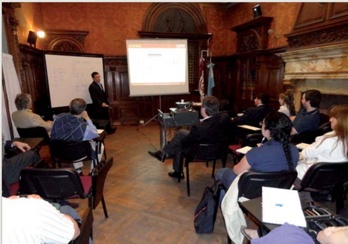
Sede Marcelo T. de Alvear 1560: Escuela de Posgrado en Derecho