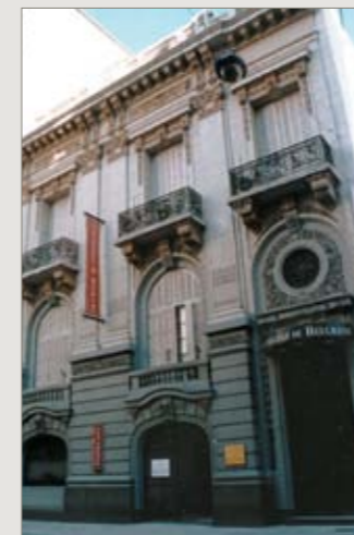
Sede Marcelo T. de Alvear 1560: Escuela de Posgrado en Negocios