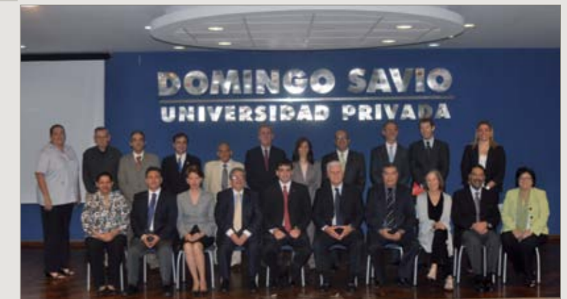
XXIV Asamblea de la RLCU. Santa Cruz de la Sierra, Bolivia, abril 2011

El eje temático de la edición: reflejar el impacto que genera la universidad al operar en su entorno y cómo retorna el acto solidario en beneficios para la organización, transformándola realmente en un ente socialmente responsable.