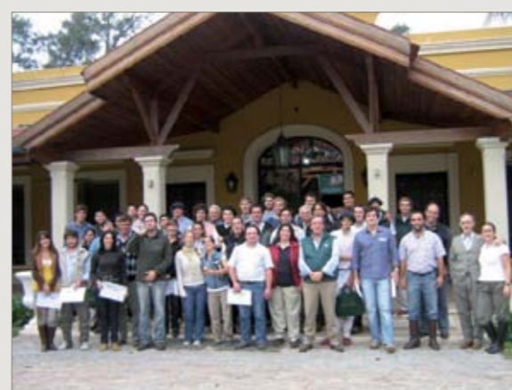
Brandsen La Mariana