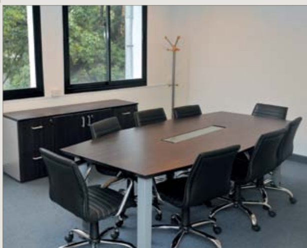
Nuevo Laboratorio de Tecnología Ambiental