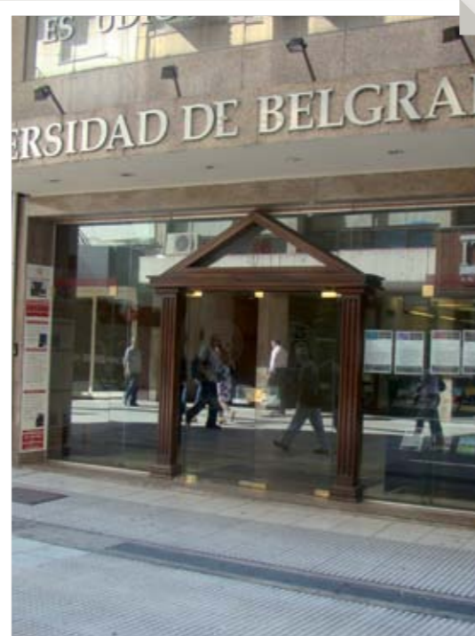
Sede Lavalley 485 Departamento de Estudios de Posgrado y Educación Continua.