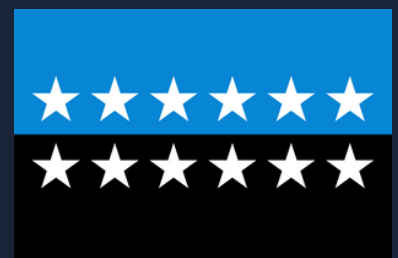
"Bandera de la CECA"

Con el propósito de evitar nuevos conflictos, diferentes Estados del continente se reunieron para darle forma a una comunidad con fines comerciales, naciendo en 1951, la Unión Europea del Carbón y del Acero (CECA), compuesta por Alemania, Bélgica, Francia, Italia, Luxemburgo y Países Bajos. Ésta congregación tenía como objetivo fundamental supervisar el mercado de carbón y acero, y procurar fortalecer relaciones comerciales estatales, cómo está fundamentado en el Tratado Constitutivo de la Comunidad Europea del Carbón y del Acero. Posteriormente, la unión evolucionó con el objeto de ampliar la cooperación económica, creando así la Comunidad Europea Económica (CEE) y la Comunidad Europea de la Energía Atómica (CEEA) mediante el tratado de Roma (Unión Europea, 2022).